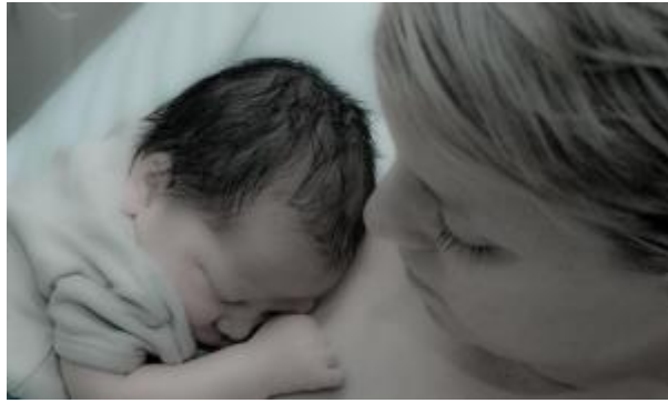
3 - Permiso por nacimiento para la madre biológica ( click aquí )