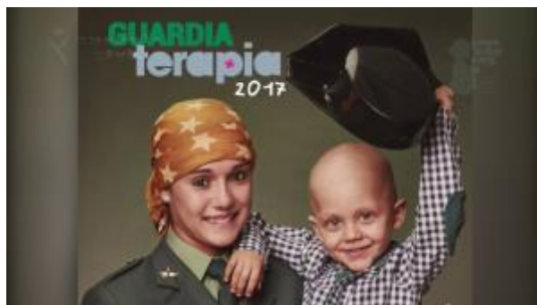
11 - Permiso y reducción de jornada para el cuidado de un hijo menor de edad afectado por enfermedad grave ( click aquí )