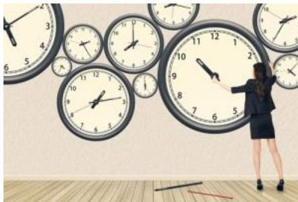
10 - Flexibilidad horaria ( click aquí )