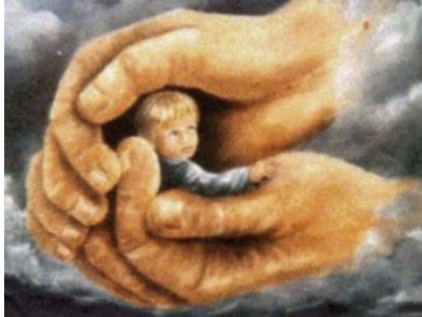
7 - Adopción y acogimiento ( click aquí )