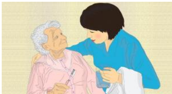
14 - Cuidado de menor de 12 años, persona mayor que requiera especial dedicación o persona con discapacidad ( click aquí )