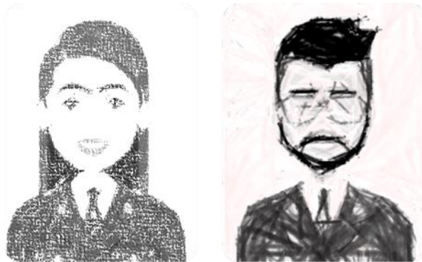
18 - Agrupamiento familiar ( click aquí )