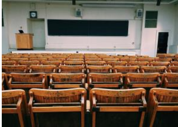
25 - Apoyo a la formación ( click aquí )