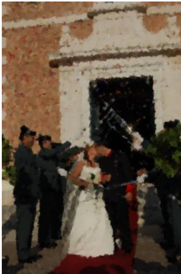
26 - Matrimonio ( click aquí )