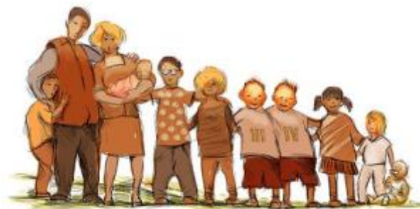
19 - Familias numerosas ( click aquí )