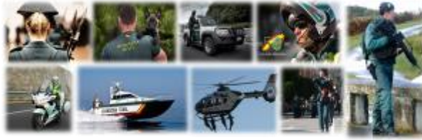
16 - Adscripción temporal ( click aquí )