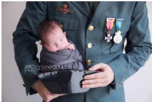
4 - Permiso del progenitor diferente de la madre biológica ( click aquí )