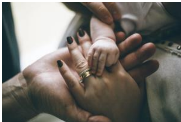
15 - Excedencia por cuidado de familiares ( click aquí )