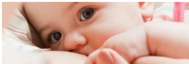
6 - Lactancia ( click aquí )