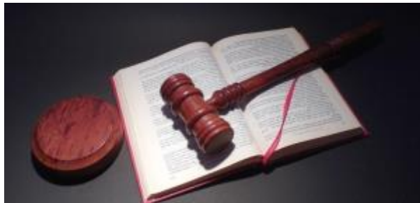
9 - Asistencia a juicio durante el disfrute de permisos por nacimiento, guarda con fines de adopción, acogimiento o adopción y lactancia ( click aquí )