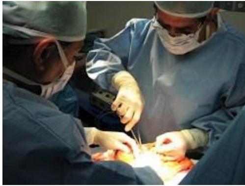
12 - Permisos por fallecimiento, accidente o enfermedad grave de un familiar ( click aquí )