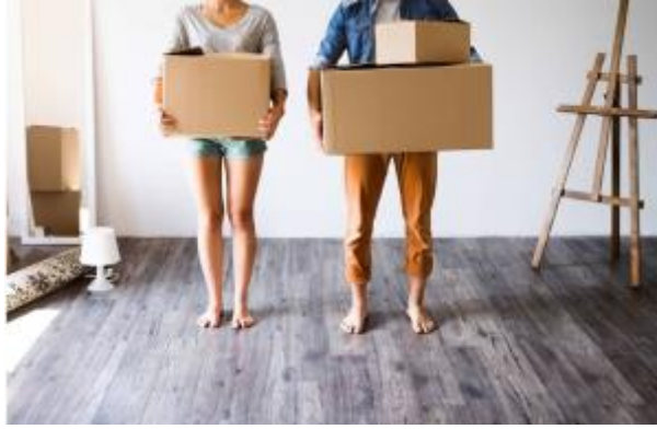
27 - Permiso por traslado de domicilio, sin cambio de residencia ( click aquí )