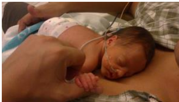
5 - Nacimiento de hijos prematuros o que tengan que permanecer en el hospital a continuación del parto ( click aquí )