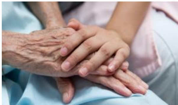
13 - Permiso para atender el cuidado de un familiar de primer grado ( click aquí )