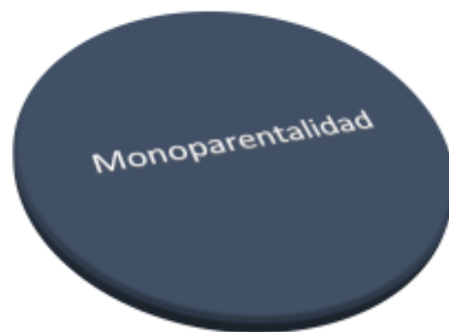
8 - Permiso por nacimiento, guarda con fines de adopción, acogimiento o adopción y lactancia en familias monoparentales ( click aquí )