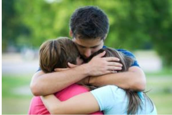
17 - Excedencia voluntaria por agrupación familiar ( click aquí )